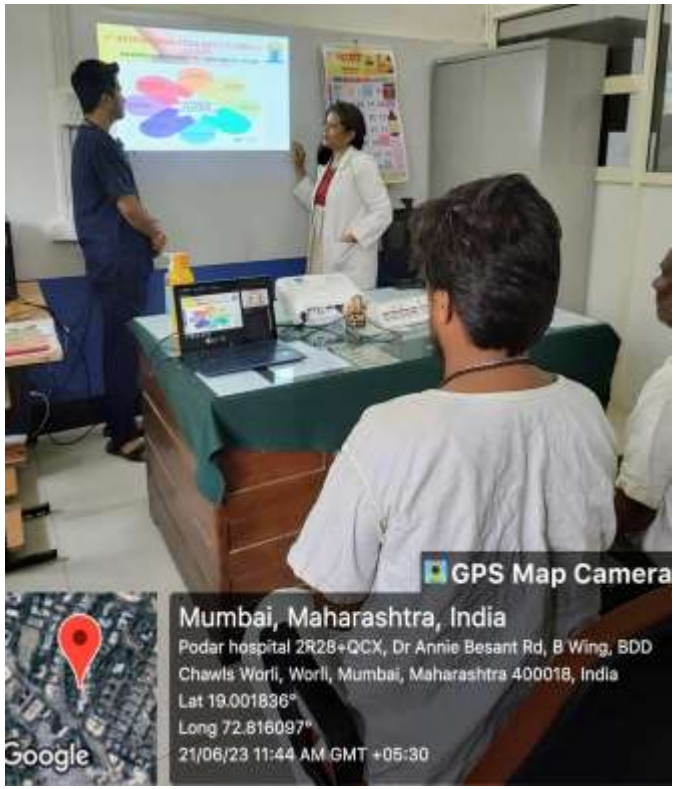
Mumbai, Maharashtra, India Podar hospital 2R2B+QCX, Dr Annie Besant Rd, B Wing, BDD Chawls Worli, Worli, Mumbai, Maharashtra 400018, India Lat 19.001836° Long 72.816097° 21/06/23 11:44 AM GMT +05:30