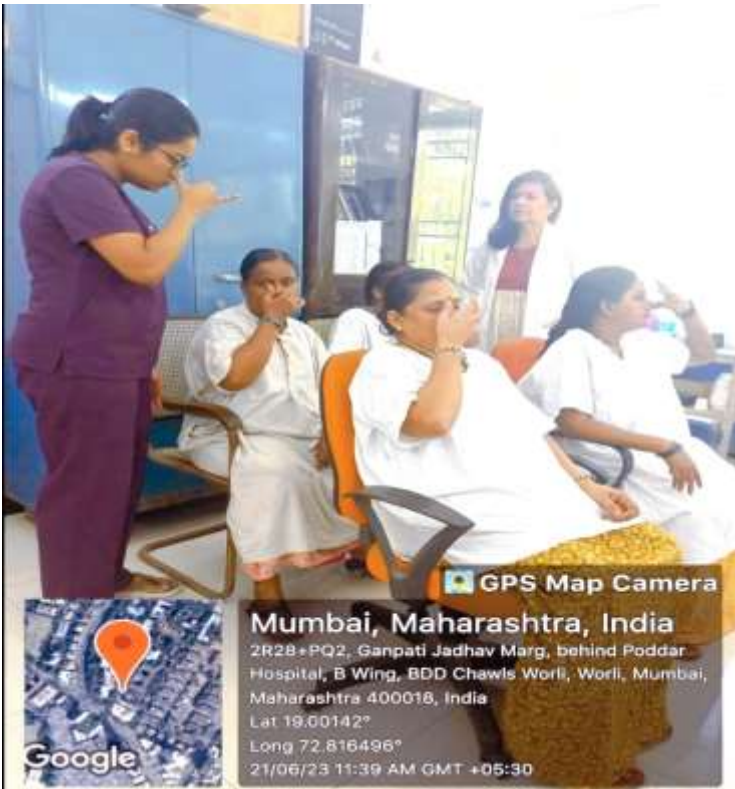
Mumbai, Maharashtra, India 2R2B+PQ2, Ganpati Jadhav Marg, behind Poddar Hospital, B Wing, BDD Chawls Worli, Worli, Mumbai, Maharashtra 400018, India Lat 19.00142° Long 72.816496° 21/06/23 11:39 AM GMT +05:30